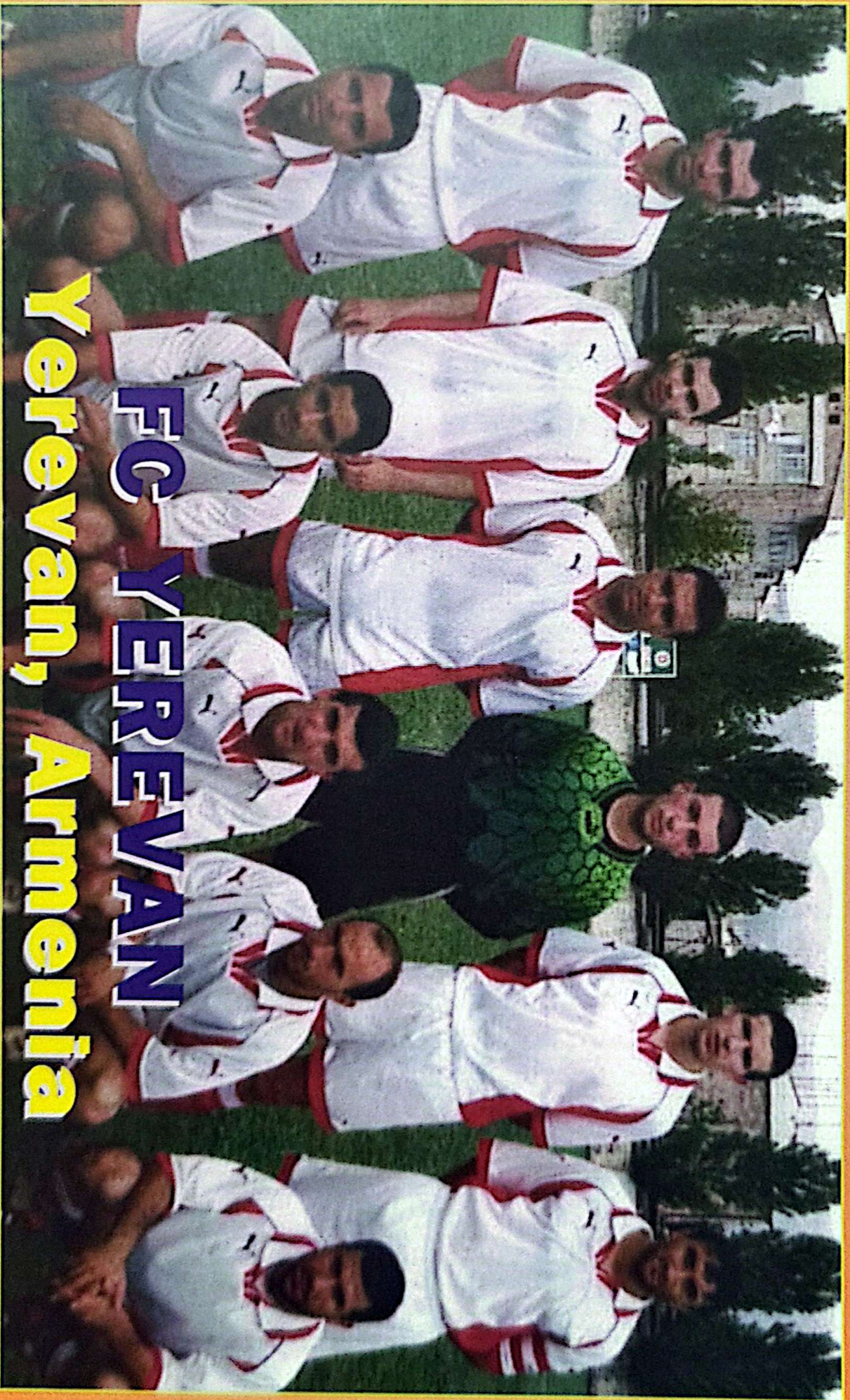
FC YEREVAN Yerevan, Armenia